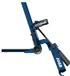
Lyft under marknivå